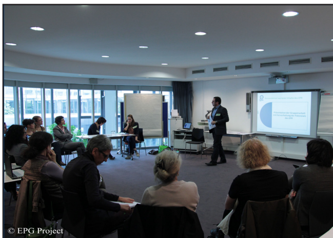
Trainingskurse zum EPG - München Goethe Institut

Sehen Sie hier Fotos aus diesen ersten Trainingskursen!